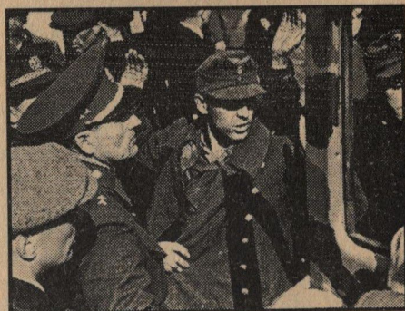
Odzbrojování německých vojáků.

německou posádku. Němečtí vojáci se však pozdě večer zmocnili zásob shromážděných v Dělnickém domě, nechali vlak s nymburskými Němci státi na nádraží a spěšně opustili město.