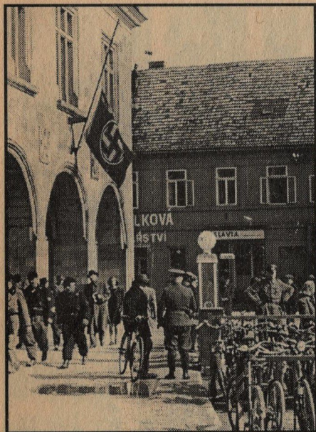
Pod říšskou vlajkou na půl žerdi na budově okresního úřadu hlídali němečtí důstojníci.