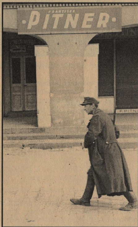
Pátého května po poledni byly po městě urychleně rozmístěny německé hlídky.