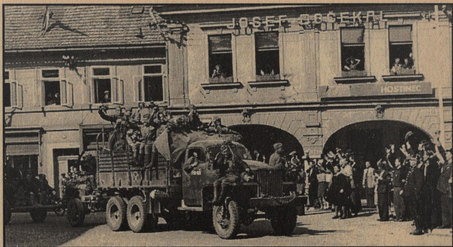
Pravidelné sovětské vojenské oddíly dorazily do osvobozeného Nymburka desátého května v podvečer.

N ymburk vstoupil druhého května do povstání v situaci, kdy přímo ve městě byla posádka o počtu šesti set mužů, v okrese 1 500 a v Milovicích 6 000 elitních, dobře vycvičených vojáků plus pancéře, děla a Innemanna letka na Božím Daru. Spojení s Prahou se podařilo udržovat linkou spojující jezy na Labi a Vltavě, o níž Němci nevěděli.