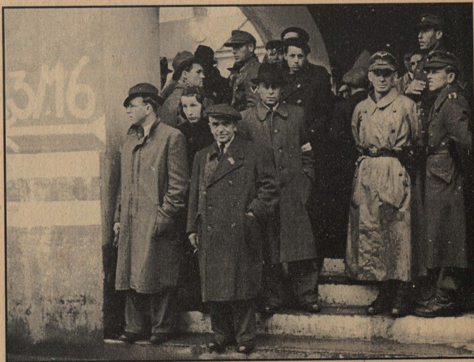
Napětí ve městě vzrůstalo. Ozbrojení Němci však začali být v davech lidí s trikolórami na klopách značně nejistí.